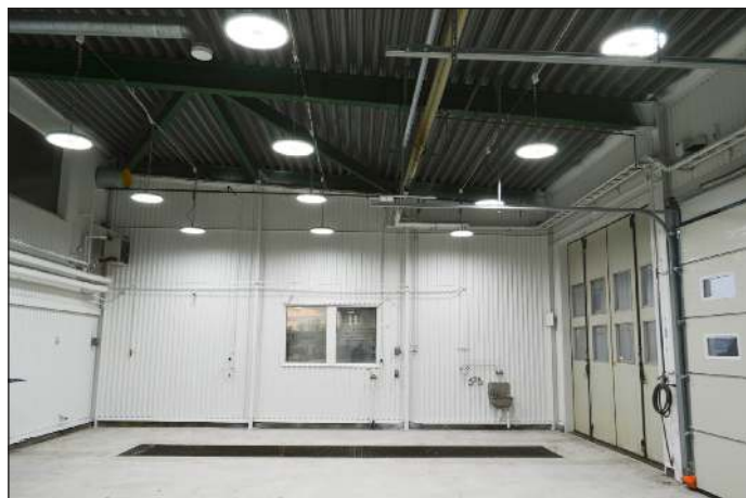
Ovan: innan innertaket kommit på plats

reglera belysningen individuellt på de olika serviceplatserna via återfjädrande strömbrytare.