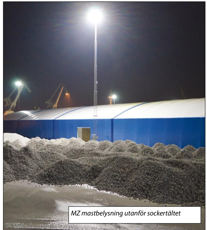
MZ mastbelysning utanför sockertältet

Pilotinstallationen av Polaris har lett till uppmärksamhet i hamnvärlden. Leif har tagit emot flera besökande kollegor från andra hamnar. Sockertältet har blivit till ett landmärke för modern magasinbelysning.